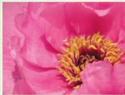
一等奖： 摄影《红妆素裹》 陈然(行政/人事部)