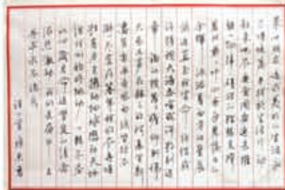
二等奖： 毛笔书法《唐诗一首》部长好(安监保卫科) 手工编织《帽子》张玲(行政/人事部) 硬笔书法《诗一首》陈杰(操作部)