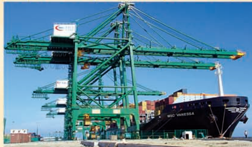
欧地线“地中海瓦内萨”号